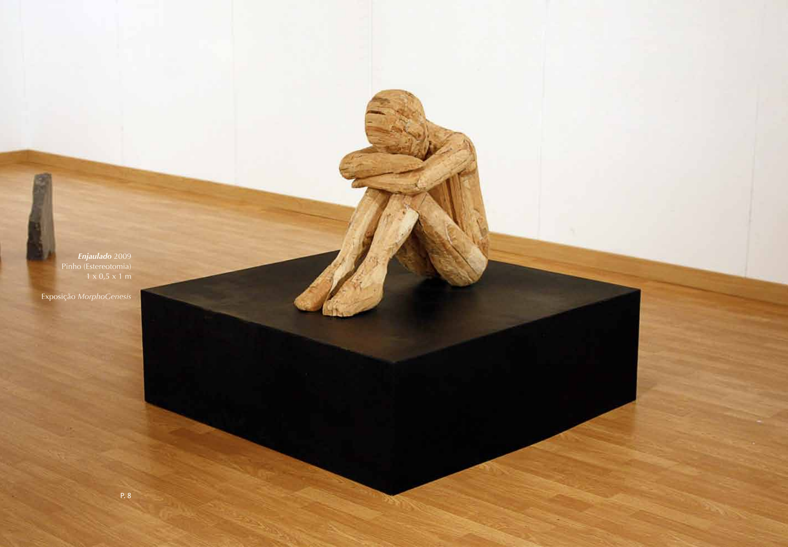
Enjaulado 2009 Pinho (Estereotomia) 1 x 0,5 x 1 m