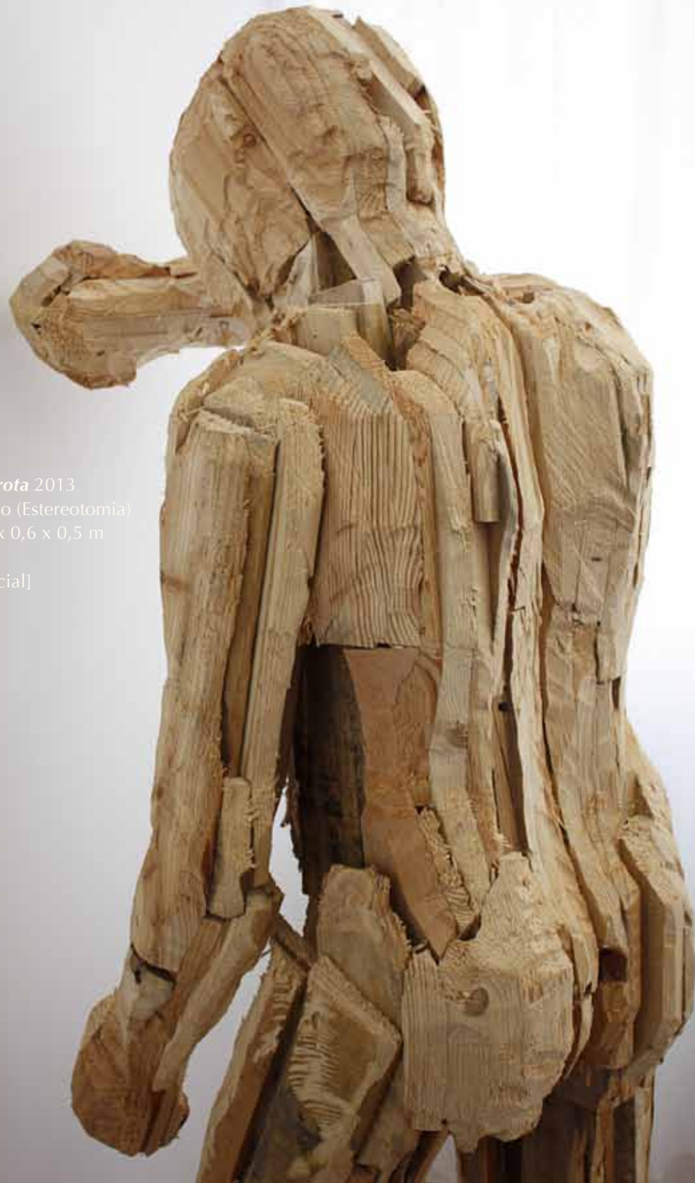
Derrota 2013 Pinho (Estereotomia) 1,8 x 0,6 x 0,5 m [parcial]