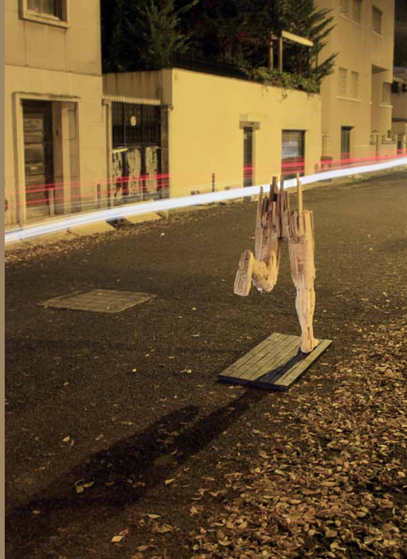
Atleta 2012 Pinho (Estereotomia) altura x comprimento x largura m