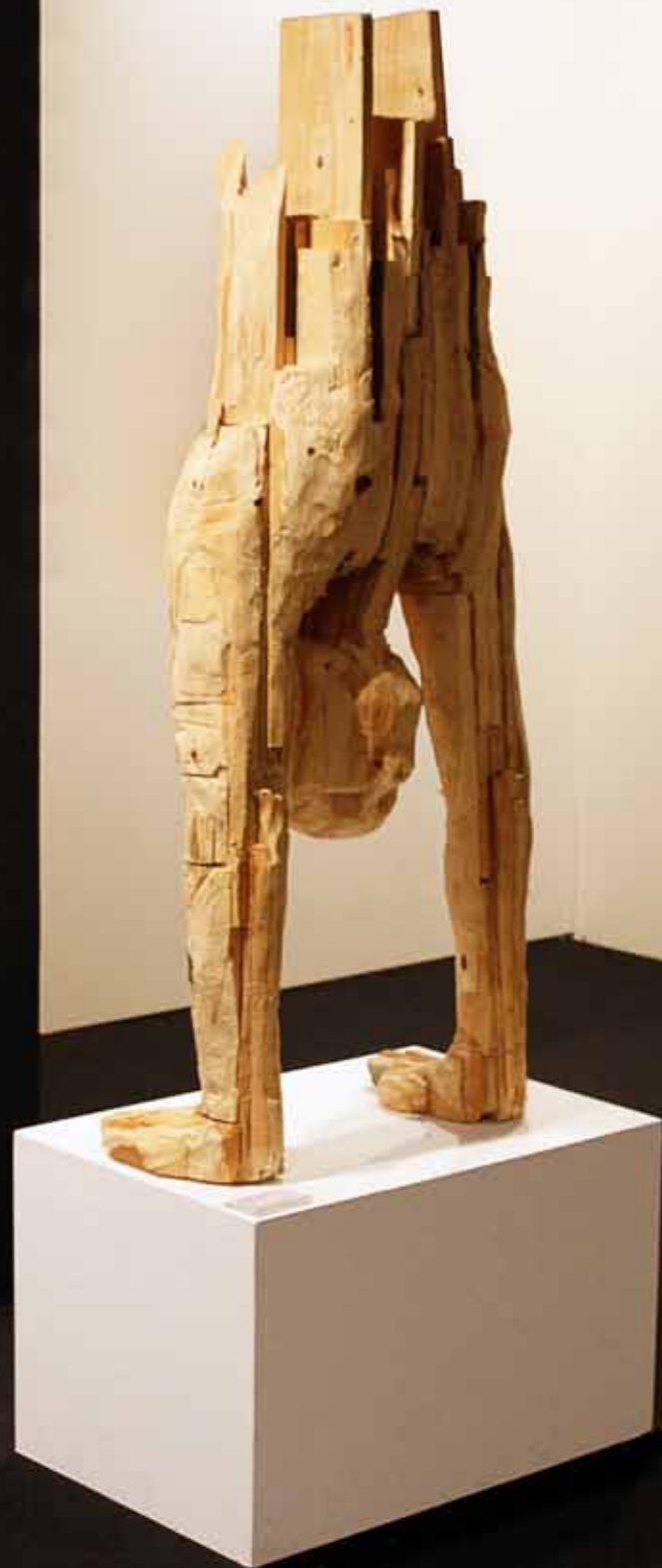
Ginasta 2013 Pinho (Estereotomia) 1,2 x 0,5 x 0,4 m