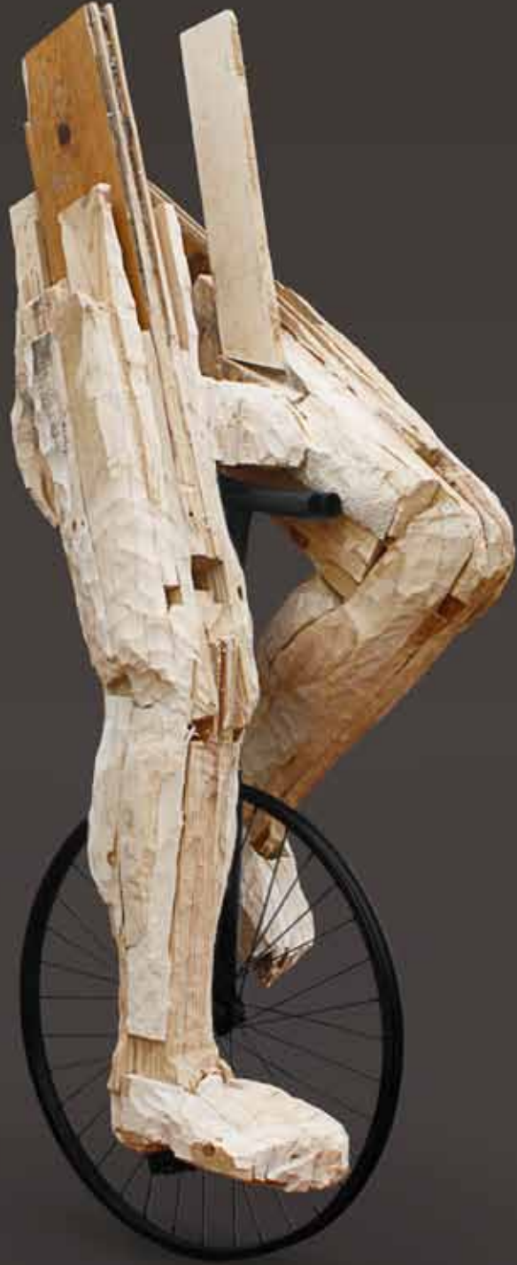
Malabarista (série) 2013 Pinho (Estereotomia) 1,5 x 0,6 x 0,5 m (com estrutura metálica)