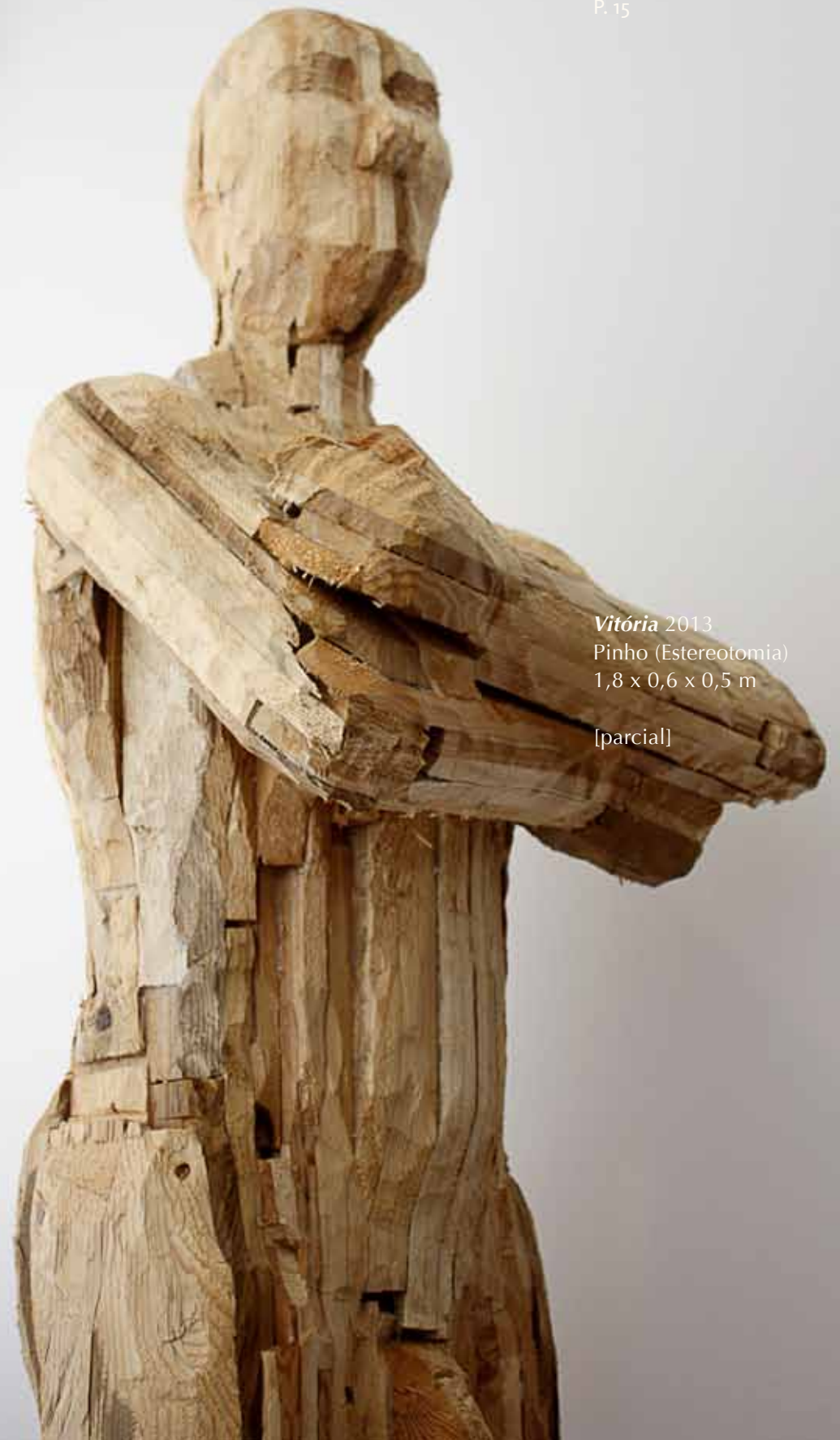
Vitória 2013 Pinho (Estereotomia) 1,8 x 0,6 x 0,5 m [parcial]