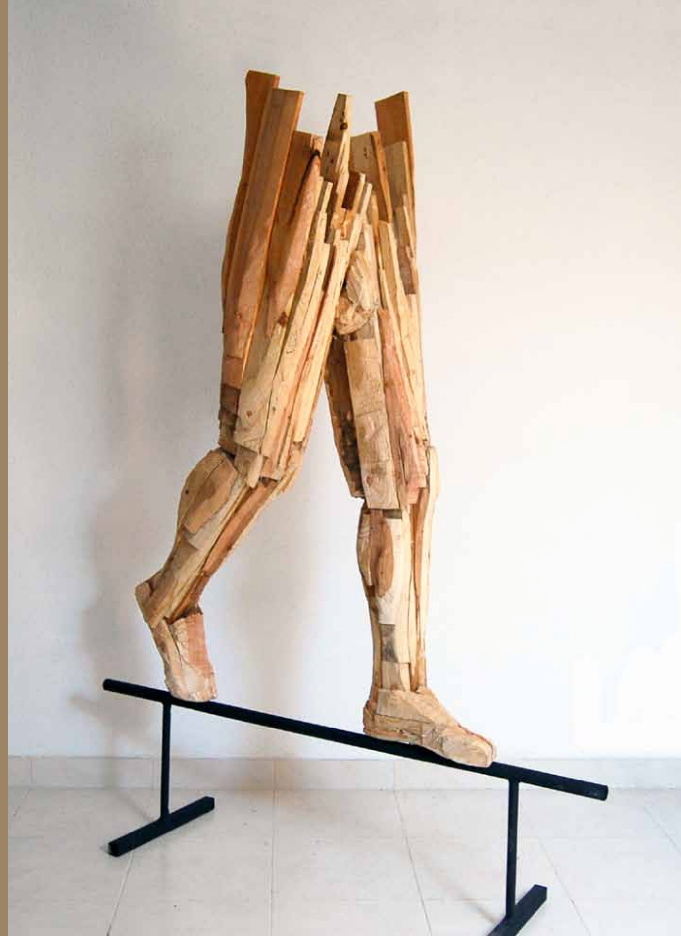
Equilíbrio 2012 Pinho (Estereotomia) 1,8 x 0,5 x 1,5 m