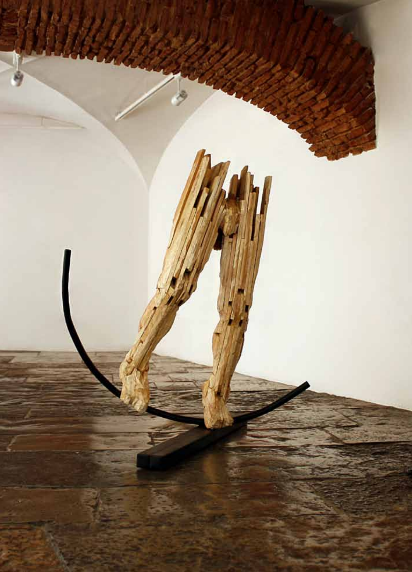
Equilibrista 2013 Pinho (Estereotomia) 1,3 x 1 x 0,8 m