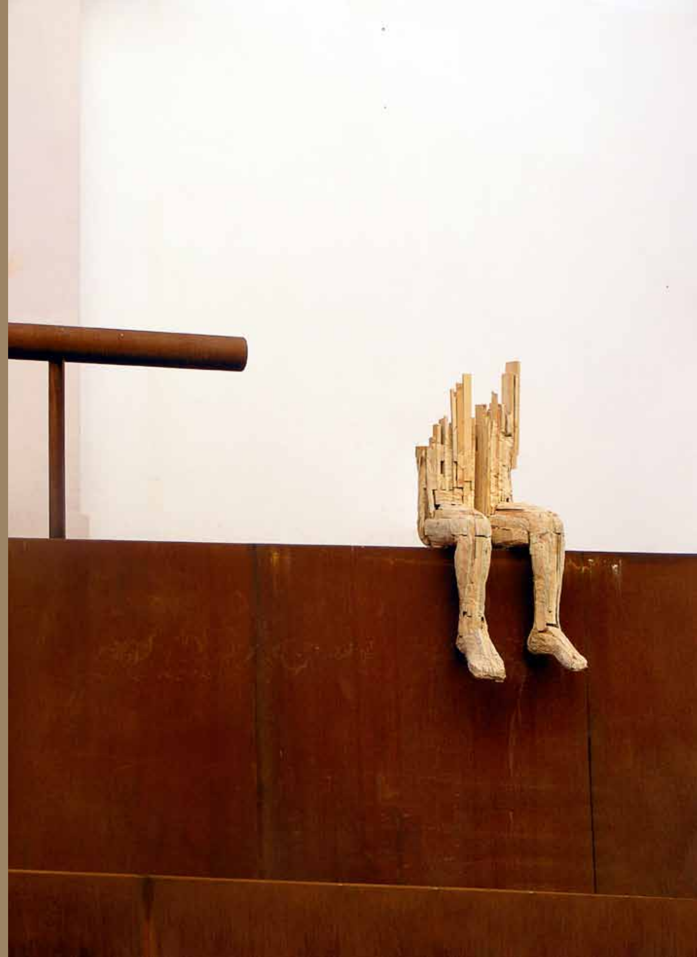
2010 Trabalhador Pinho (Estereotomia) 1,5 x 0,6 x 0,7 m