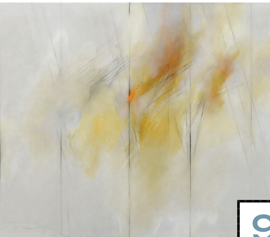
Cuatro semanas , por Fernando Zóbel, 1982, óleo sobre lienzo, 130 x 150 cm.