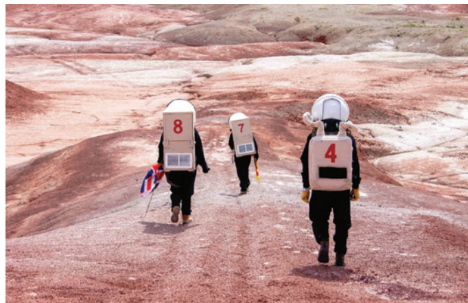
Misión análoga LATAM III , realizada en las instalaciones de la Mars Desert Research Station, en Utah (USA), en mayo de 2019 © Mariona Badenes Agustí.

Ciencia, arte y literatura se dan la mano en el gran proyecto expositivo del CCCB, Marte. El espejo rojo , que indaga sobre la condición y el futuro de nuestra especie y que coincide con la llegada de tres misiones espaciales que renovarán el conocimiento que tenemos de este planeta. Dividida en tres grandes bloques, Marte en el cosmos antiguo , Ciencia y ficción en el Planeta Rojo y Marte en el antropoceno , la muestra, formada por más de 400 objetos entre libros incunables, esculturas, dibujos, fotografías, películas, cómics y un meteorito marciano, estudia los distintos relatos que se han generado a lo largo de la historia y reflexiona también sobre el futuro: la crisis climática o la vida humana en otro planeta. Hasta el 11 de julio.