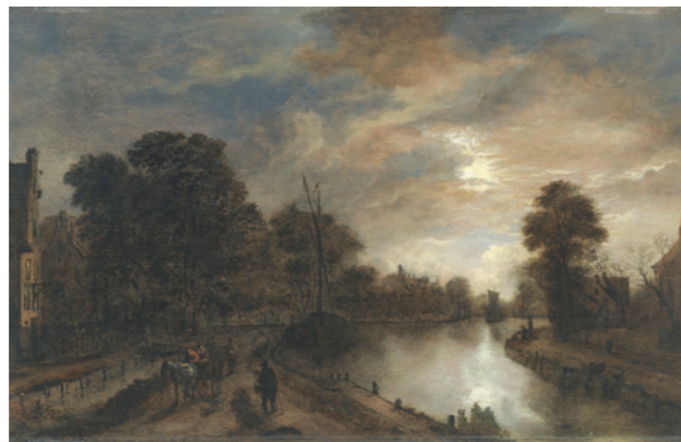
Sobre estas líneas, Claro de luna con un camino bordeando un canal , por Aert van der Neer, h. 1645-50, óleo sobre tabla, 35,6 x 65,5 cm, Madrid, Museo Thyssen-Bornemisza. Arriba, Horizontes luminosos , por Alberto Reguera, 2020, técnica mixta sobre lienzo, 101 x 151 x 7,5 cm, colección del artista.

EL PINTOR SE HA INSPIRADO EN UN PAISAJE DE AERT VAN DER NEER DE LA COLECCIÓN DEL MUSEO THYSSEN PARA CREAR UNA SERIE DE PINTURAS QUE SE MUESTRAN EN LA SALA-BALCÓN DE LA PINACOTECA