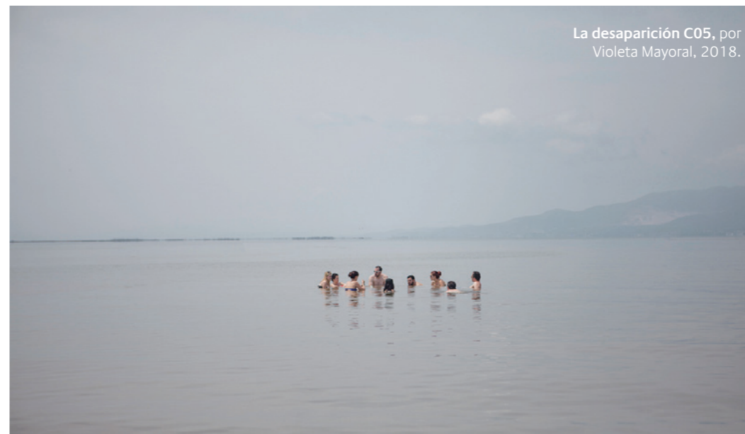
La desaparición C05 , por Violeta Mayoral, 2018.

comisariada por Martina Millà, las imágenes de la artista fluctúan entre la ausencia de límite y el intento de medir palmo a palmo la inmensidad del espacio en busca de refugio, es decir, la artista ubica la experiencia humana a cielo descubierto, sin techo ni abrigo, en unos paisajes vacíos e inabarcables que subrayan la vulnerabilidad de esa experiencia. Hasta el 2 de mayo. T