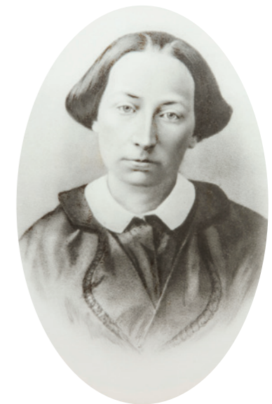
Retrato de Concepción Arenal , fotografía de Barke y Ferriz, h. 1870, Colección Borja García-Arenal Alvarado.