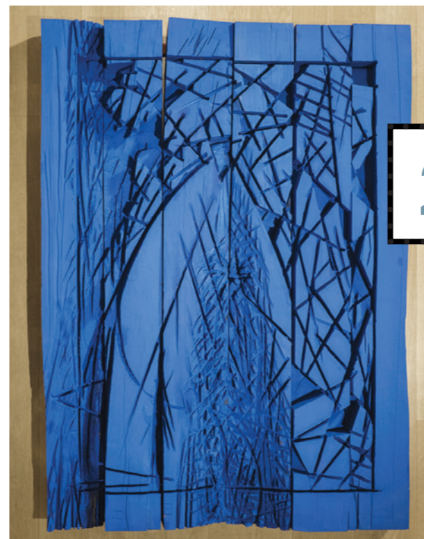
Atúum...! , por Pablo Maojo, 2018, madera de roble y añil, 112 x 137 x 14 cm, depósito del artista.

similitud entre el paisaje de Castilla y el holandés, en el encuentro de la niebla con la tierra, en esas dos masas enormes de color”, añade. Reguera, que vive y trabaja entre Madrid y París y que ha pasado largas estancias en Holanda y Noruega, y se siente vinculado también a los grandes paisajistas franceses y asiáticos, explora los efectos de la luz que se filtra desde las capas subyacentes de la pintura y aflora hasta la superficie del lienzo, produciendo un efecto de deslumbramiento. “Esta muestra presenta imaginadas variaciones pictóricas del cielo, concebido como un espacio de profundidad visual lleno de contrastes”, explica Reguera en el catálogo. Las dimensiones de los cuadros de la muestra se han determinado a partir de las proporciones de la tabla de Van der Neer, y el pintor ha ensanchado y dado grosor al lienzo, extendiendo la pintura por los márgenes de las telas hasta conseguir una contemplación tridimensional de las obras. Hasta el 9 de mayo. T