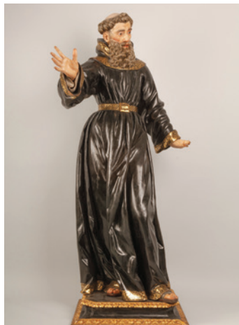
Santa Rita de Casia y San Agustín de Hipona , por Juan Alonso Villabrille y Ron, h. 1701-33, madera tallada y policromada, Valladolid, Museo Nacional de Escultura.