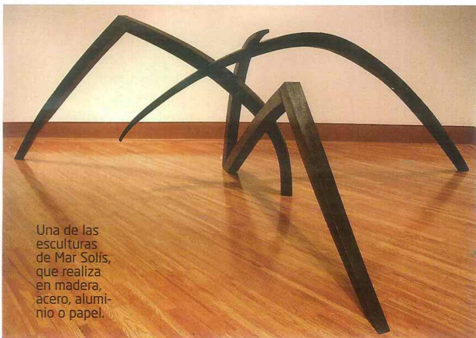
Una de las esculturas de Mar Solís, que realiza en madera, acero, aluminio o papel.